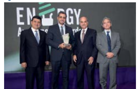
جائزة تقديرية ل «مشروع السطح الأخضر في مصرف لبنان» من تنفيذ مصرف لبنان بالتعاون مع Cedro.

جمعت جوائز الوعي حول الطاقة أكثر من ٣٥ مشترك