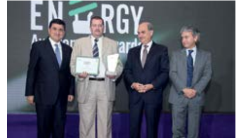
المرتبة الأولى «مشروع الإنارة على الطاقة الشمسية في مستديرة السلام في طرابلس» من تنفيذ مديون لطرابلس