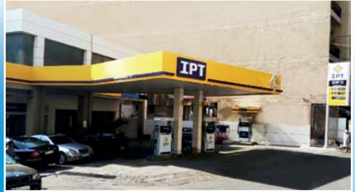
محطة الجعيتاوي - الأشرفية (بيروت)