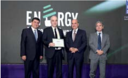
شهادة تقدير ل «مشروع إطلاق أول نظام هجين يعمل على الطاقة الشمسية والديزل في لبنان» من تنفيذ معهد البحوث الصناعية IRI