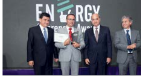
المرتبة الثانية «مشروع توفير الطاقة» في شركة دبّانة سيقلي» من تنفيذ PESCO Energy