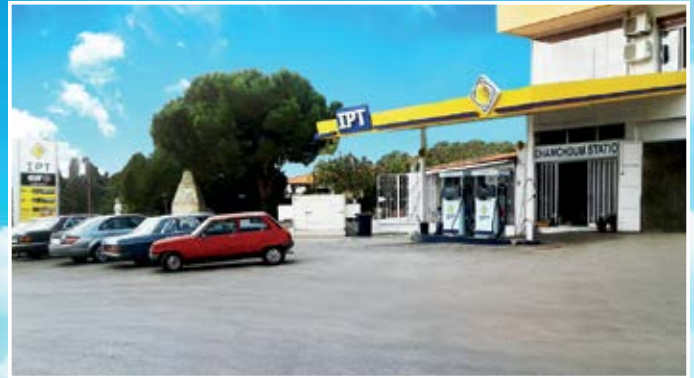
محطة شمشوم - مزيرة (زغرتا)