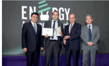
المرتبة الثانية «مشروع توليد الطاقة الشمسيّة» من تنفيذ Elements Sun & Wind