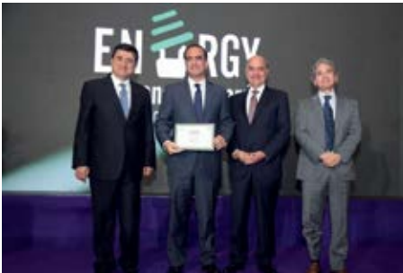
شهادة تقدير ل «مشروع إطلاق القرض البيئي» من تنفيذ مصرف فرنسبنك