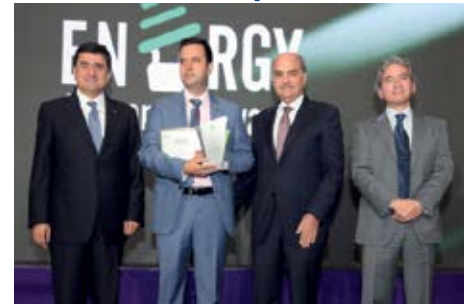
المرتبة الأولى «برنامج نجيب للعمل الوطني لكفاءة الطاقة في البناء» من تنفيذ الحلف الأخضر