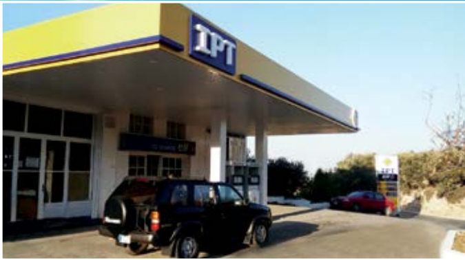
محطة يوسف ساسين - بزينا (الكورة)