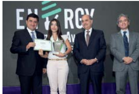
المرتبة الثانية «برنامج الشهادات للمدارس الخضراء» من تنفيذ e-Ecosolutions