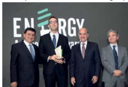
جائزة تقديرية ل «مشروع نهر بيروت للطاقة الشمسية» من تنفيذ وزارة الطاقة والمياه MOEW والمركز اللبناني لحفظ الطاقة LCEC