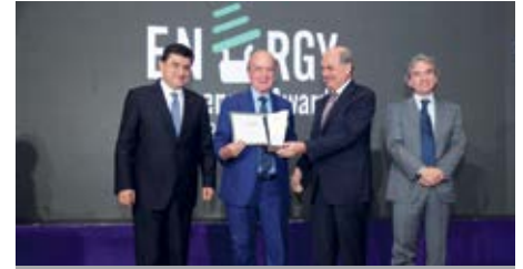
المرتبة الأولى «مشروع طاولة عميق التنموي البيئي» من تنفيذ محمّية أرز الشوف