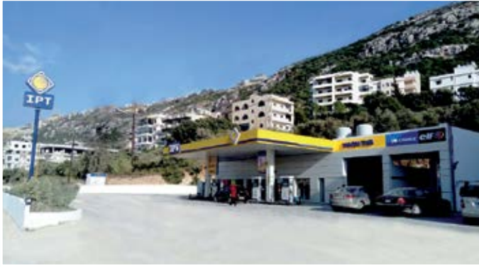
محطة الشيخ - القلمون (طرابلس)

يسرنا الإعلان عن افتتاح محطة جديدة بإدارة أي بي تي في منطقة الجعيتاوي في الأشرفية. كما وأن أي بي تي تعمل باستمرار على تجديد وتحسين محطاتها لتحافظ على امتيازها وتكون دائماً لزيائنها مركز ثقة، راحة وأمان. وقد شملت الأعمال مؤخراً ثلاثة محطات في شمال لبنان: محطة الشيخ في القلمون، محطة شمشوم في مزيرة، محطة يوسف ساسين في بزينا.